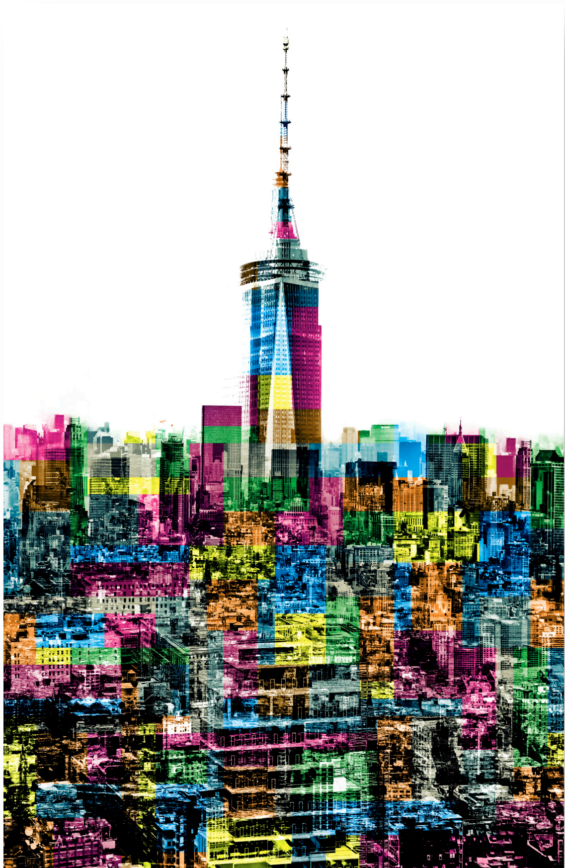
ARTWORK „NY-OTC_C“ DIGITAL PAINTING BIS ZU | UP TO 120 CM X 180 CM MATERIAL AUF WUNSCH | MATERIAL ON REQUEST