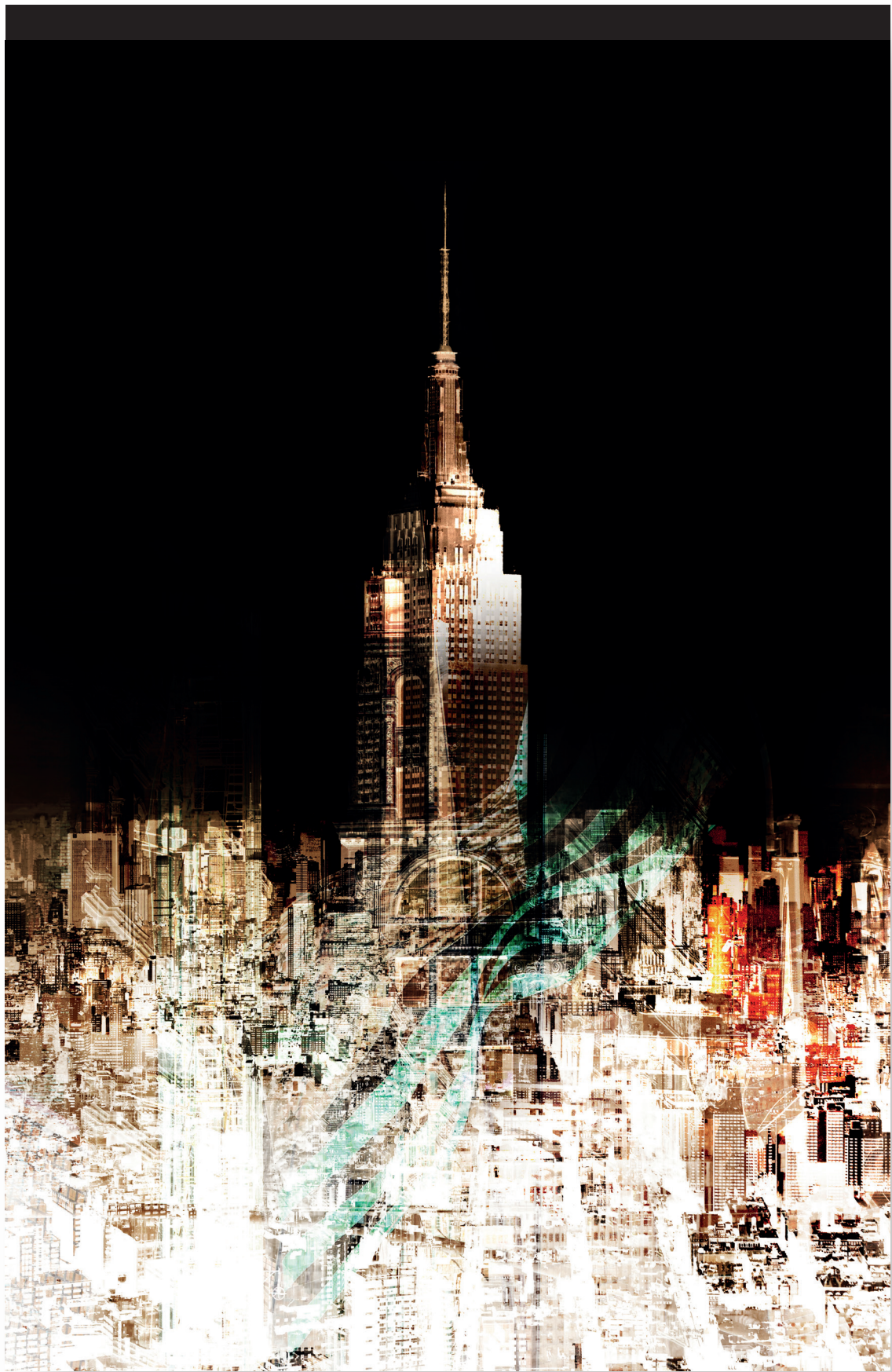
ARTWORK „NY-ESB_D“ DIGITAL PAINTING BIS ZU | UP TO 120 CM X 180 CM MATERIAL AUF WUNSCH | MATERIAL ON REQUEST