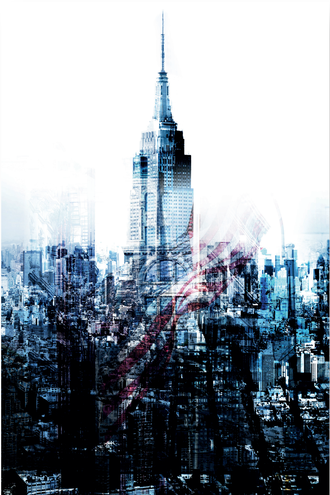
ARTWORK „NY-ESB_B“ DIGITAL PAINTING BIS ZU | UP TO 120 CM x 180 CM MATERIAL AUF WUNSCH | MATERIAL ON REQUEST