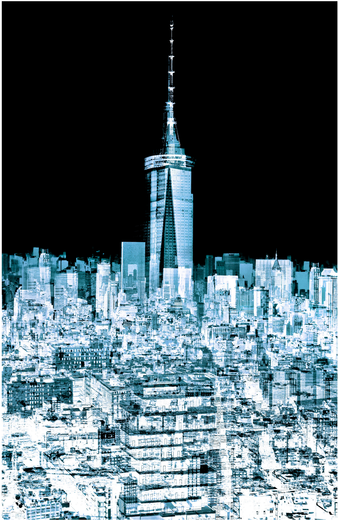
ARTWORK „NY-OTC_D“ DIGITAL PAINTING BIS ZU | UP TO 120 CM X 180 CM MATERIAL AUF WUNSCH | MATERIAL ON REQUEST