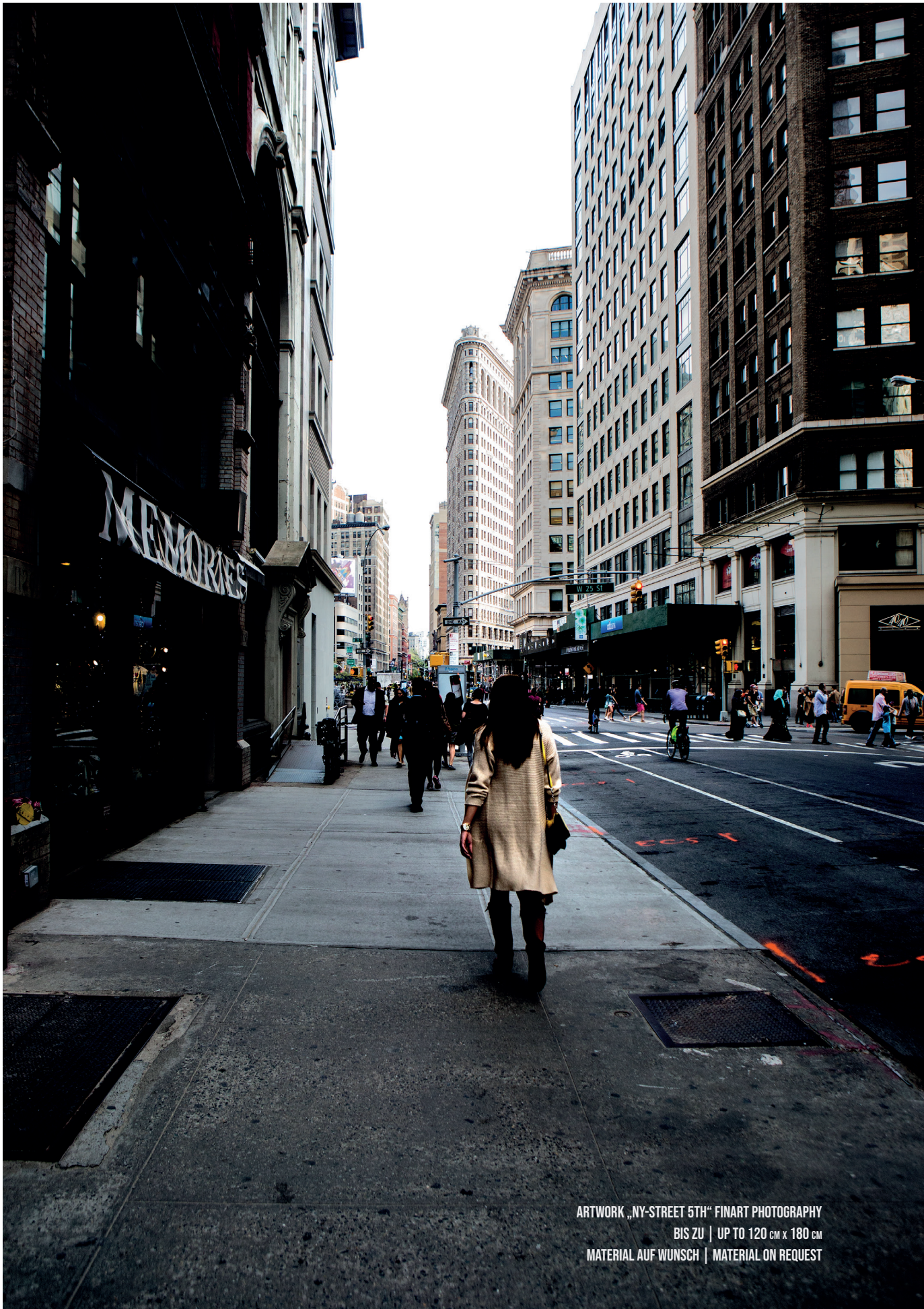
ARTWORK „NY-STREET 5TH“ FINART PHOTOGRAPHY BIS ZU | UP TO 120 CM x 180 CM MATERIAL AUF WUNSCH | MATERIAL ON REQUEST